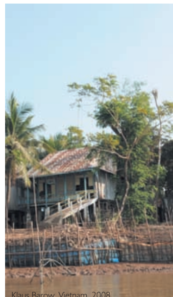
Klaus Barow, Vietnam, 2008

AUTAN Family Zeckenschutz Spray Die Milch zum Sprühen aus der AUTAN® FAMILY Serie, die neben Mücken- auch Zeckenschutz bietet. Laut Herstellerangabe bis zu 4 Stunden Schutz vor Zecken, bis zu 8 Stunden Schutz vor Mücken. 100ml. Nr. 20-71558-005-00 12,95 €